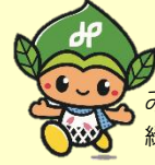
みどりっち 緑区マスコットキャラクター

身近な方が認知症になった時、認知症を正しく理解すること、 そしてご家族だけで抱え込まないことが、とても大切です。 名古屋市では、ご家族の方を対象に「家族教室」「家族サロン」「医師の相談」、 すべての方を対象に「認知症サポーター養成講座」を開催しています。 まずはぜひお気軽にお問い合わせください。